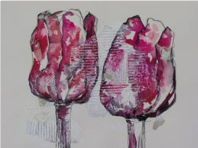
Paso 3 Pintar los tulipanes en tonalidades rojas y violeta.