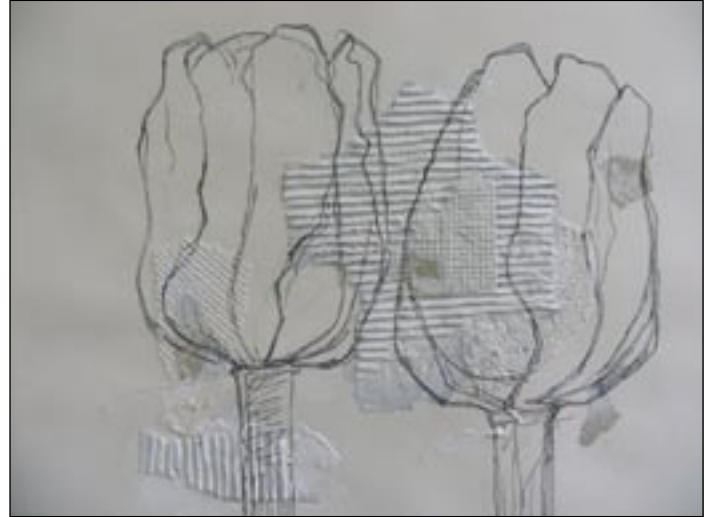
Paso 2 Pintar con Gesso el cartón ondulado de blanco. Usar la paletina. Hacer el esbozo de los tulipanes con el rotulador. Tirar muchas líneas para avivar la obra.