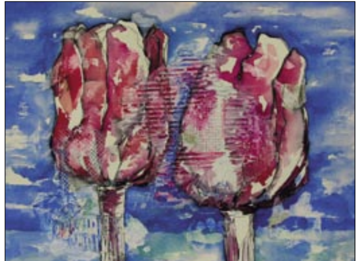
Paso 4 Pintar el cielo con Azul cobalto y Azul brillante. Aplicar más rojo en los tulipanes para cubrirlos bien.