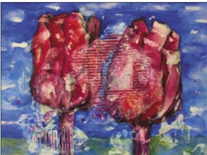
Paso 5 Finalmente, intensificar el fondo, aplicándole más azul.